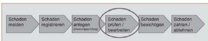
▼ Abbildung 1 Schadenprozess